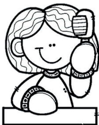
Cepillarse el pelo