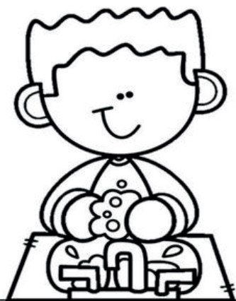
Lavarse las manos