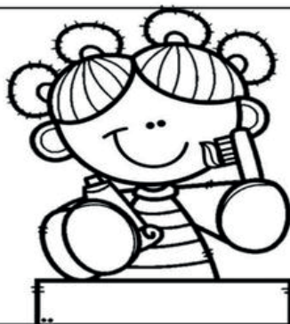
Lavarse los dientes